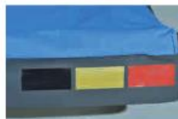
Système externe optionnel